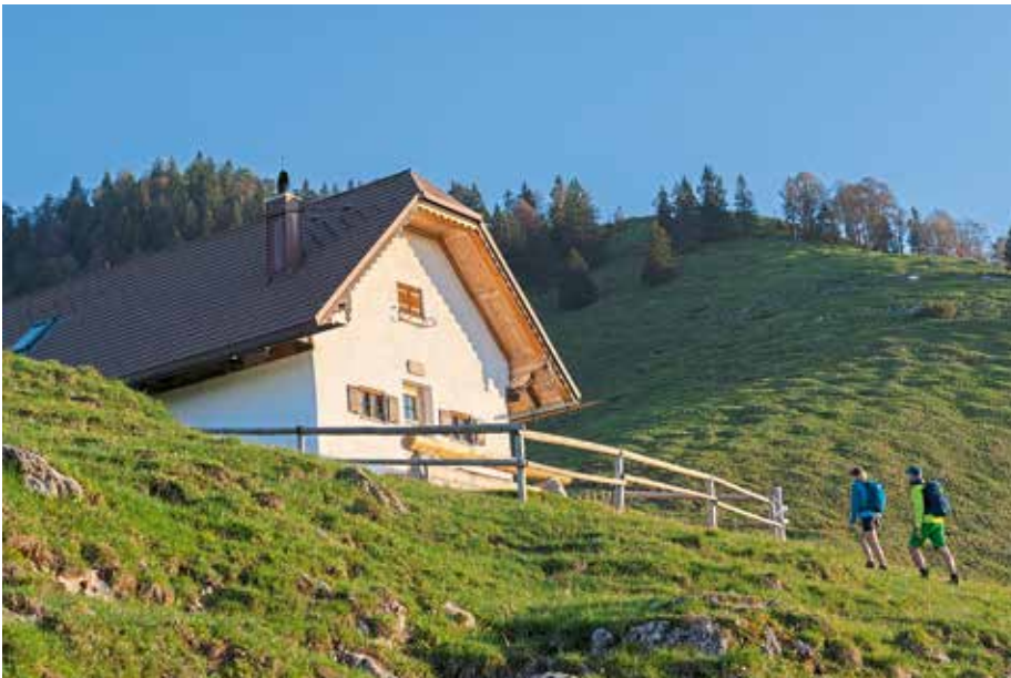
Staffelalm am Rabenkopf