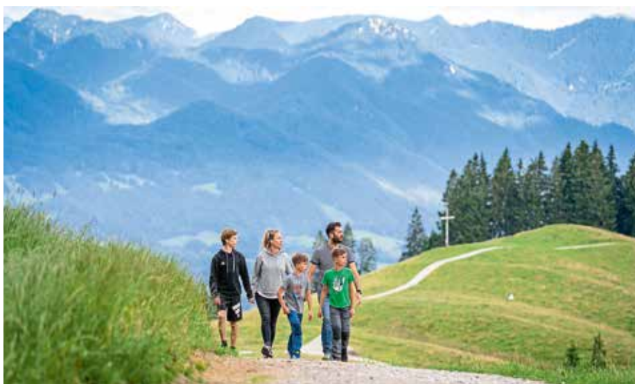
Wanderung am Blomberg