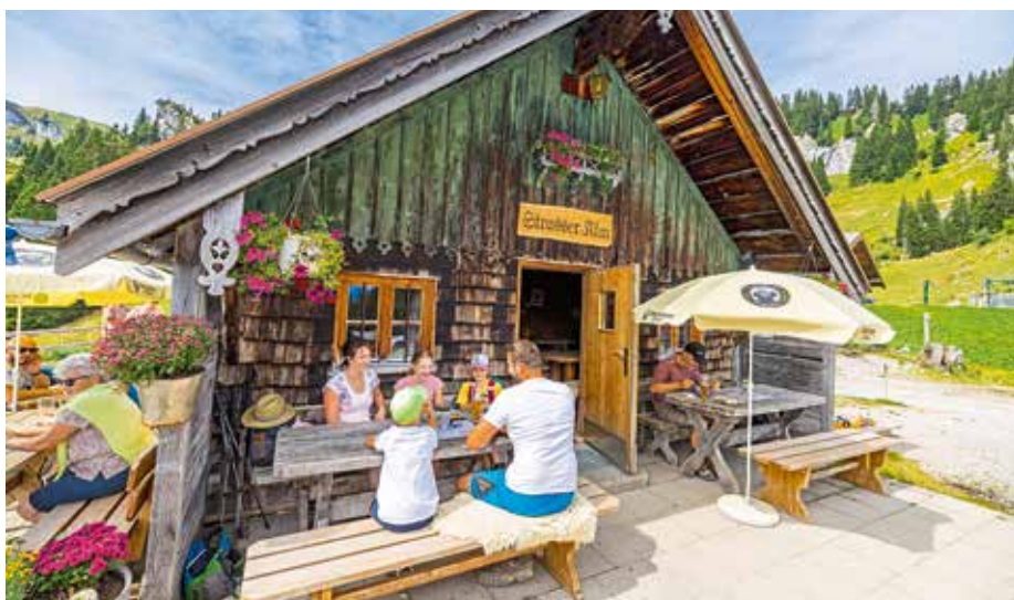
Pause auf der Strasser-Alm am Brauneck