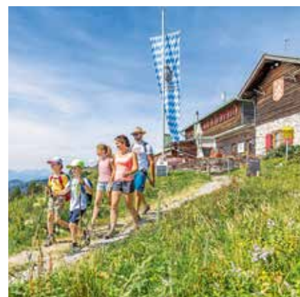
Wandern am Brauneck