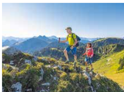
Wandern am Seekarkreuz