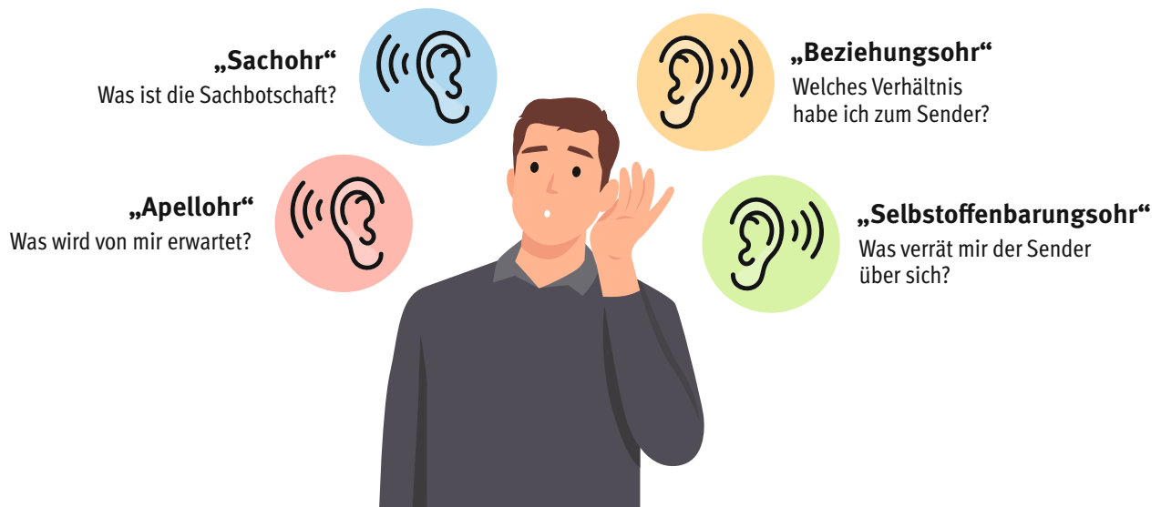
Abbildung 1: Vier-Ohren-Modell, eigene Darstellung nach Schulz von Thun

Mit dem Vier-Ohren-Modell von Friedemann Schulz von Thun 2 lassen sich Missverständnisse und mögliche Fehlinterpretationen in der Kommunikation erklären. Es kann aber auch dabei helfen, durch entsprechendes Handeln Lösungswege aufzuzeigen.